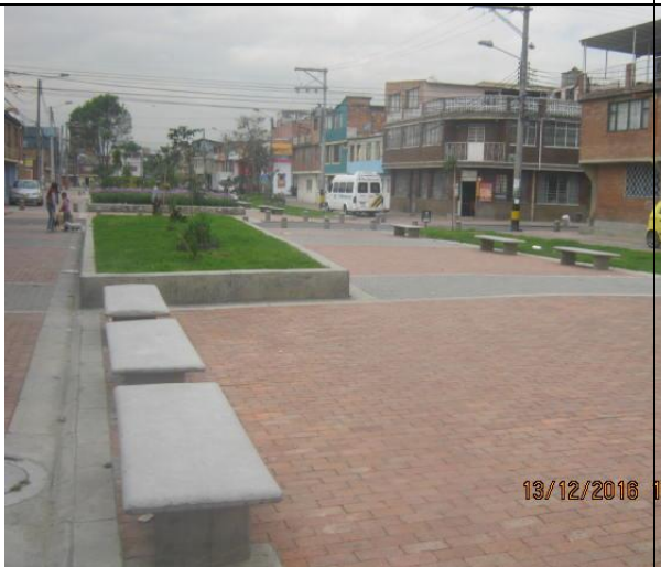
Foto 6. Bolardos en concreto