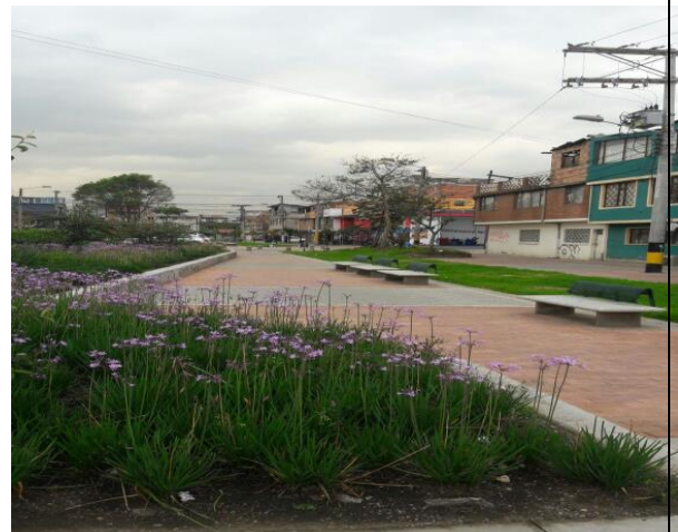
Foto 12. Panorámica General Intervención realizada