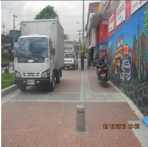
Foto 11. Adoquín rectangular en arcilla